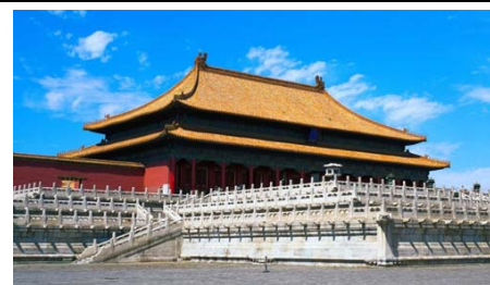
故宫 Forbidden City