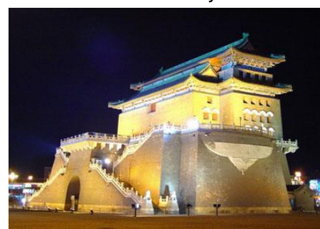
正阳门城楼 Zheng Yang Gate Museum