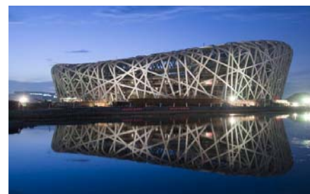
国家体育馆鸟巢 National Stadium – Bird's Nest