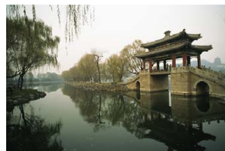
颐和园 Summer Palace

Shopping : Jade, Silk, Tea, Foot Massage, Pi Xiu